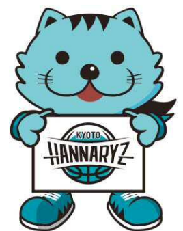
京都ハンナリーズマスコット はんなり

弊社の「使命」とは、「住まい」を通じてお客様により豊かな人生を送って頂けるようなお手伝いさせて頂くことです。永く愛される企業となることを願う私達は、日々の事業や CSR 活動等を通じて「地域社会に根ざした企業」となること、そして企業理念である「人々の暮らしに悦びの輪を広げる」ことの2つを実現し続けて参ります。そのために、社員一同が心ひとつとなつて社会への感謝(貢献)と、お客様との関係構築に、今後もより一層力を注いで参ります。