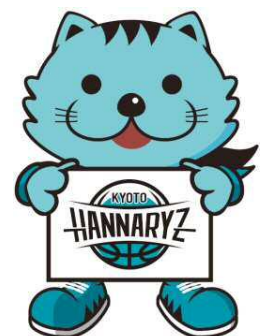
京都ハンナリーズマスコット はんなりん

弊社の「使命」とは、「住まい」を通じてお客様により豊かな人生を送って頂けるようなお手伝いさせて頂くことです。永く愛される企業となることを願う私達は、日々の事業やCSR活動等を通じて「地域社会に根ざした企業」となること、そして企業理念である「人々の暮らしに悦びの輪を広げる」ことの2つを実現し続けて参ります。そのために、社員一同が心ひとつとなって社会への感謝(貢献)と、お客様の創造に今後もより一層力を注いで参ります。