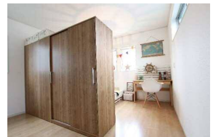
▲可動式棚で仕切っても 十分な広さの 10 帖

2 階の子ども部屋は 10 帖のワンルームに。幼児期は遊び部屋として広く使え、 小学生になれば机を並べて勉強することができる広さです。空間の共有や教え合 いを通じて、兄弟間のコミュニケーション機会や絆を育む設計の部屋を採用。一緒に 様々なことを並んでできる為、やる気や競争心が生まれ、向上心を育てることも可能 です。成長し、スペースを分けたいときは真ん中に可動式の収納棚を置いて仕切ること でプライバシーを確保しつつ、お互いの繋がりを感じながら過ごすことができます。 グローバル世代のスーパーキッズに大切な「違う個性を受け入れ、尊重する」考えも 自然と身に付きます。