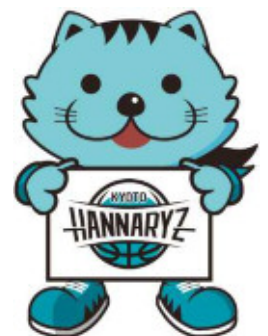
京都ハンナリーズマスコット はんなり

弊社の「使命」とは、「住まい」を通じてお客様により豊かな人生を送って頂けるようなお手伝いさせて頂くことです。永く愛される企業となることを願う私達は、日々の事業やCSR活動等を通じて「地域社会に根ざした企業」となること、そして企業理念である「人々の暮らしに悦びの輪を広げる」ことの2つを実現し続けて参ります。そのために、社員一同が心ひとつとなって社会への感謝(貢献)と、お客様の創造に今後もより一層力を注いで参ります。