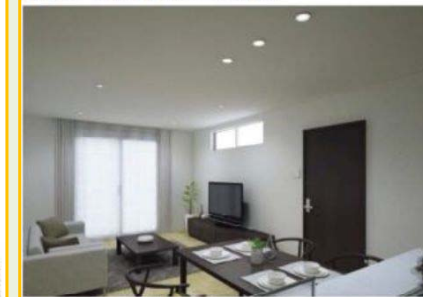
シーン1 | 朝食時や勉強に適したあかり 爽やかで明るく生き生きとした活動的な雰囲気。 1日のはじめの朝食時に適したあかり。