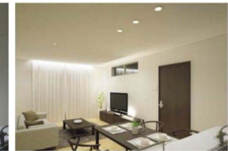
シーン2 | だんらんに適したあかり 明るさと華やかさを兼ね備えたあかり。 多人数が多目的に使用するマルチなリビングに最適。