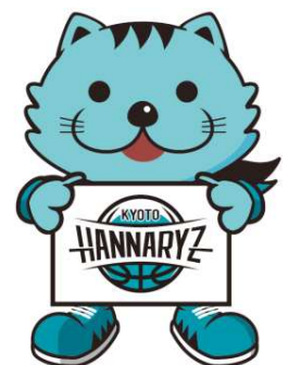
京都ハンナリーズマスコット はんなりん

弊社の「使命」とは、「住まい」を通じてお客様により豊かな人生を送って頂けるようなお手伝いさせて頂くことです。永く愛される企業となることを願う私達は、日々の事業やCSR活動等を通じて「地域社会に根ざした企業」となること、そして企業理念である「人々の暮らしに悦びの輪を広げる」ことの2つを実現し続けて参ります。そのために、社員一同が心ひとつとなって社会への感謝(貢献)と、お客様の創造に今後もより一層力を注いで参ります。