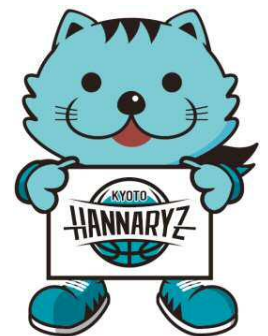
京都ハンナリーズマスコット はんなり

弊社の「使命」とは、「住まい」を通じてお客様により豊かな人生を送って頂けるようなお手伝いさせて頂くことです。永く愛される企業となることを願う私達は、日々の事業やCSR活動等を通じて「地域社会に根ざした企業」となること、そして企業理念である「人々の暮らしに悦びの輪を広げる」ことの2つを実現し続けて参ります。そのために、社員一同が心ひとつとなつて社会への感謝(貢献)と、お客様との関係構築に、今後もより一層力を注いで参ります。