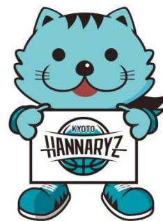
京都ハンナリーズマスコット はんなり

弊社の「使命」とは、「住まい」を通じてお客様により豊かな人生を送っていただけるようお手伝いさせて頂くことだと考えております。永きにわたり支持される企業となることを願う私達は、日々の事業や CSR 活動等を通じて「地域社会に根ざした企業」となることと、企業理念である「人々の暮らしに悦びの輪を広げる」の2つを実現し続ける為、社員一同一丸となって社会への感謝（貢献）とお客様の創造に今後もより一層注力し努力を重ねてまいります。