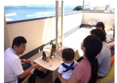
▲オープンイベントの様子