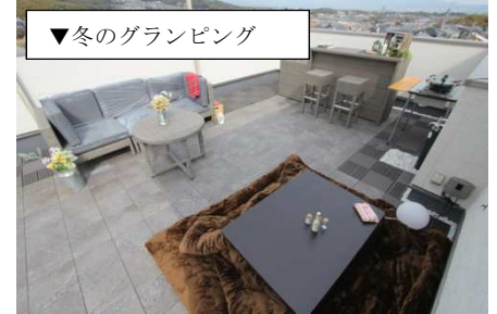
▼冬のグランピング