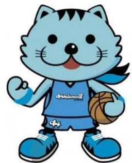
京都ハンナリーズマスコット はんなり

弊社の「使命」とは、「住まい」を通じてお客様により豊かな人生を送っていただけるようお手伝いさせて頂くことだと考えております。永きにわたり支持される企業となることを願う私達は、日々の事業や CSR 活動等を通じて「地域社会に根ざした企業」となることと、企業理念である「人々の暮らしに喜びの輪を広げる」の2つを実現し続ける為、社員一同一丸となって社会への感謝（貢献）とお客様の創造に今後もより一層注力し努力を重ねてまいります。