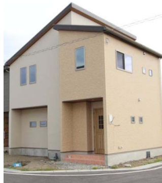
▲モデルハウス外観

ベストセラー「一生リバウンドしない奇跡の3日片付け」（講談社）を実際の生活で活用し、具現化できるような家に内蔵しました。