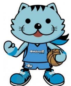
京都ハンナリーズマスコット はんなリリン

弊社の「使命」とは、「住まい」を通じてお客様により豊かな人生を送っていただけるようお手伝いさせて頂くことだと考えております。永きにわたり支持される企業となることを願う私達は、日々の事業やCSR活動等を通じて「地域社会に根ざした企業」となることと、企業理念である「人々の暮らしに悦びの輪を広げる」の2つを実現し続ける為、社員一同一丸となって社会への感謝（貢献）とおお客様の創造に今後もより一層注力し努力を重ねてまいります。