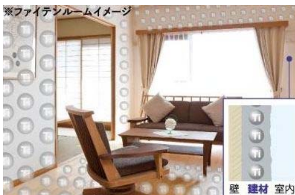
※ファイテンルームイメージ