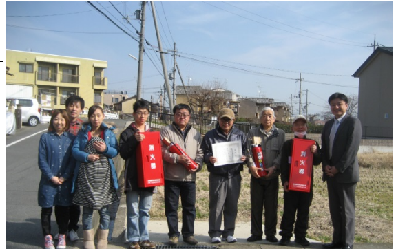
【2 月 1 日 地域の皆様と】

平成 26 年 2 月 1 日（土）、嵯峨野自治会連合会へ 消火器と格納庫 10 セット を寄贈しました。順次、弊社分譲地を含めた街路に設置される予定です。当日は、連合会長、自治会の皆様にお集まり頂き、日頃の防災活動についての話しを伺いました。火災発生の際には、被害を最小限に抑える為に消火器による初期消火がとても大切です。消火器を使うことがないことを願うばかりですが、もしもの際には役立てていただき、地域の安心と安全の向上に貢献することができればと思います。