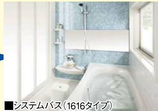
■システムバス(1616タイプ)