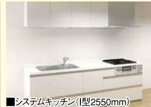
■システムキッチン(型2550mm)