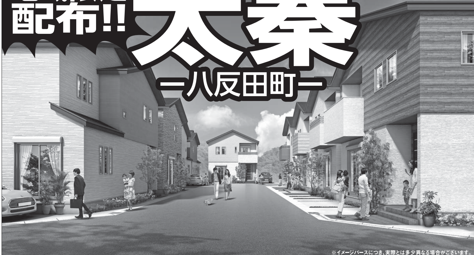
※イメージバースにつき、実際とは多少異なる場合がございます。

京都市立 子育て安心 南太秦小学校 320m(徒歩4分) 京都市立 太秦中学校 880m(徒歩11分)